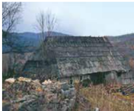
Sl. 2. Fotografija kuće koja potječe iz Skrade

Početakom 18. stoljeća brojnost kuća nije bila velika, međutim u njima su boravile porodične zadruge s brojnim članovima. Tako se iz topografske karte izdane 1764. može isčitati da su u Skradi bile tri kuće i dva stana. Stanovi su širi pojam od kuće i u njima je mogao boraviti zaselak s ljudima i stokom.