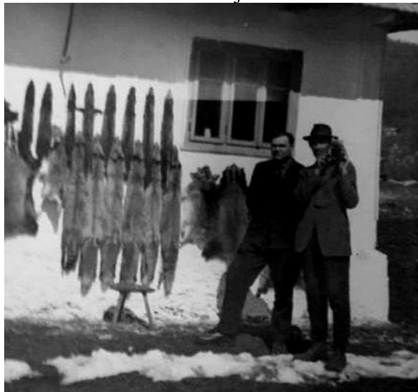
Sl. 4. Kože krznaša ulovljenih u Skradi

Lovili su krznaše, a neke porodice prihoduj, prodajom krzna, jednu četvrtinu godišnjeg prihoda u novcu (sl.4).